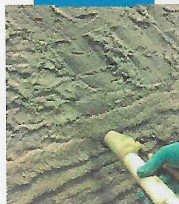
Particolare della fase applicativa