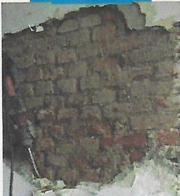
Demolizione dell'intonaco esistente